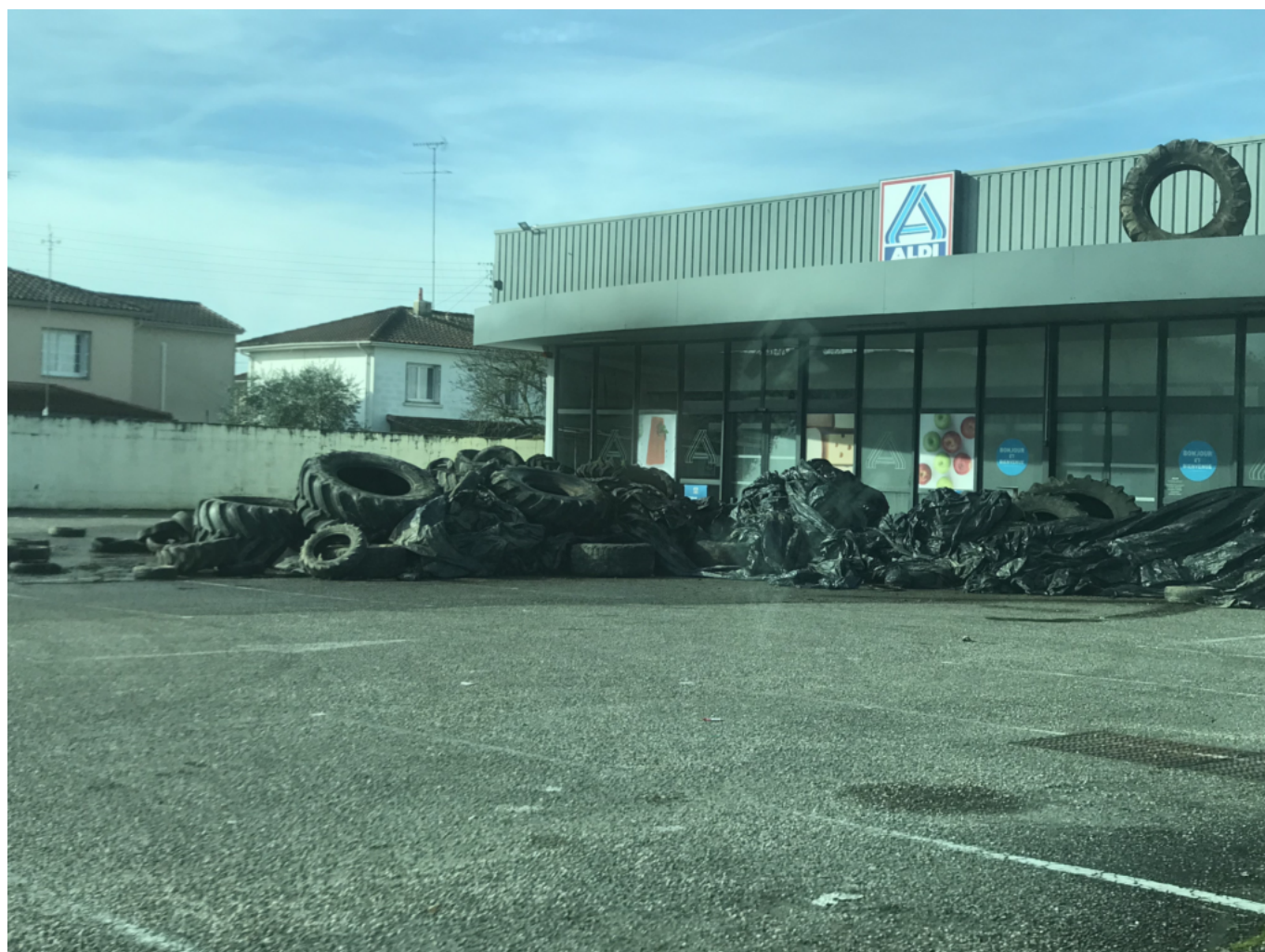
A la fin du mois de janvier 2024, un supermarché Aldi après le

Panneaux retournés, slogans « on marche sur la tête » inscrits sur des meules, pétitions et débats... Comme ailleurs en Europe, la colère agricole s'est fait entendre en Suisse depuis le début de l'année. Pourtant, hormis la descente d'une trentaine de tracteurs à Genève au début du mois de février – action pilotée par l'organisation Uniterre – force est de constater que la mobilisation est toujours restée sage chez dame Helvetia. Ainsi, entre nos frontières, pas de blocages d'autoroutes, d'aéroports ou de « siège » de ville.