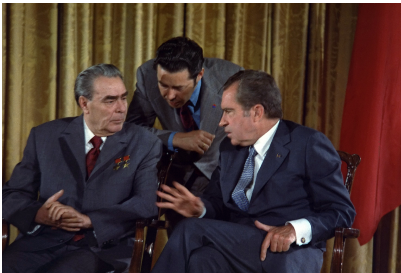
Avec Nixon lors d'une visite officielle aux États-Unis en 1973.

de la Tchécoslovaquie en août 1968. Il avait une volonté de désidéologiser (page 298) les relations internationales qui n'était pas partagée par tous les dirigeants du Kremlin. Une coopération est nouée dès 1966 avec la France dans le domaine spatial. Un rapprochement avec l'Allemagne de l'Ouest commence dès 1969. Et surtout, il parvient en 1972 à des accords de désarmement avec les États-Unis de Nixon – quant à lui, un sincère partisan de la paix.