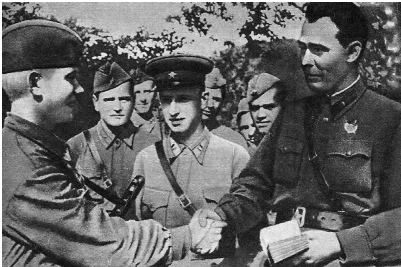
Breznev (à droite) commissaire politique en 1942.

Il finit la deuxième Guerre mondiale comme général de brigade. Même en tenant compte de la protection de Khrouchtchev et de Mekhlis, il paraît douteux qu'un individu d'une médiocrité absolue ait pu atteindre un tel grade à l'âge de trente-huit ans.