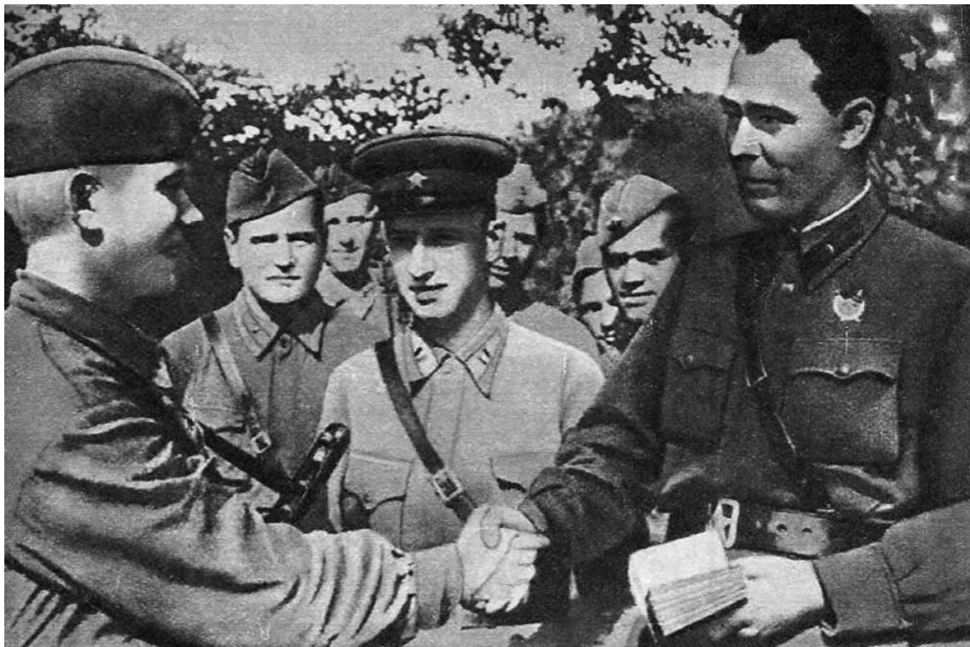
Brejnev (à droite) commissaire politique en 1942.

Il finit la deuxième Guerre mondiale comme général de brigade. Même en tenant compte de la protection de Khrouchtchev et de Mekhlis, il paraît douteux qu'un individu d'une médiocrité absolue ait pu atteindre un tel grade à l'âge de trente-huit ans.